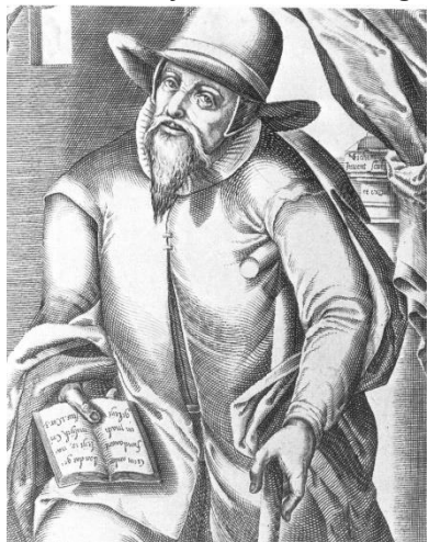
Menno Simons - Groningen