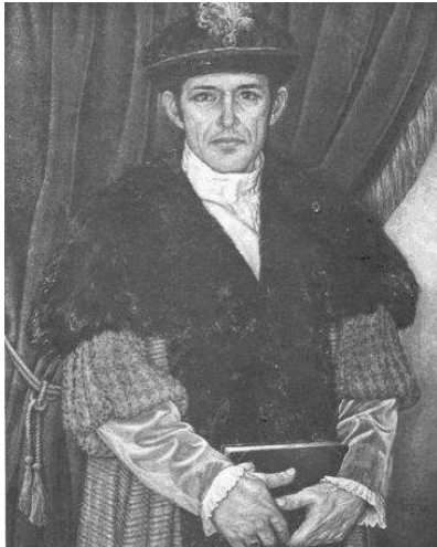
Conrad Grebel - Zürich 1525

online dienst uit de kerk van Groningen voor de gemeenten in het GDS-gebied